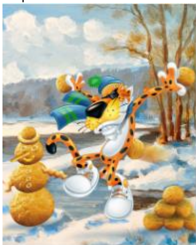
Etap V 30.11.2022 – 06.12.2022