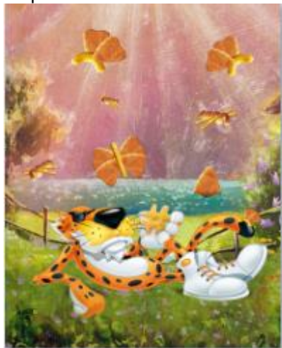
Etap IV 23.11.2022 – 29.11.2022