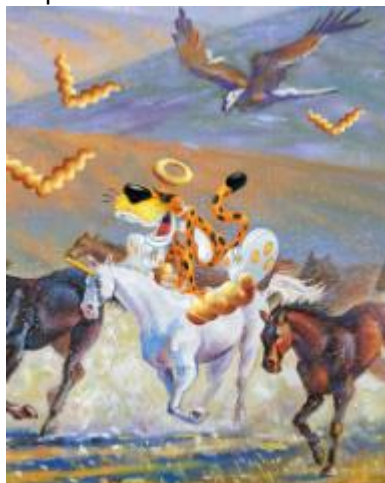
Etap VIII 21.12.2022 – 27.12.2022