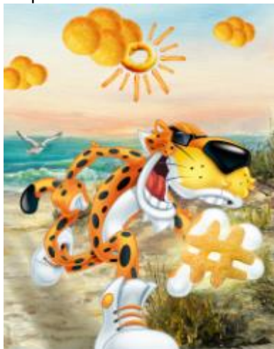
Etap VI 07.12.2022 – 13.12.2022