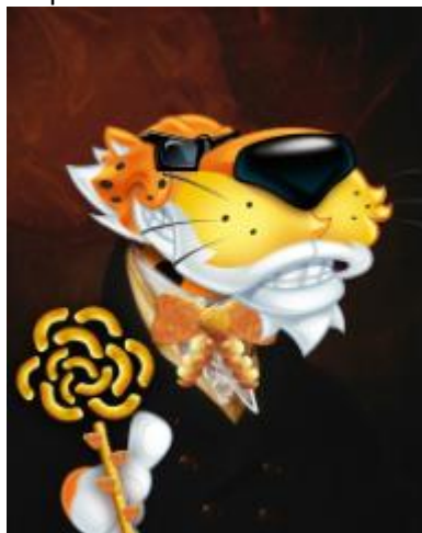
Etap VII 14.12.2022 – 20.12.2022