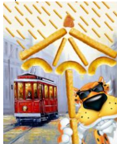
Etap II 09.11.2022 – 15.11.2022